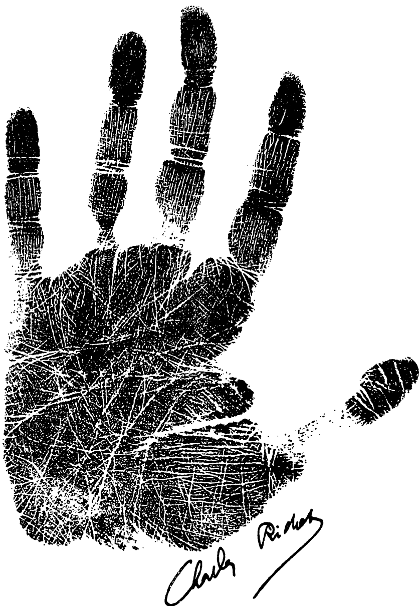
Le professeur Charles RICHET